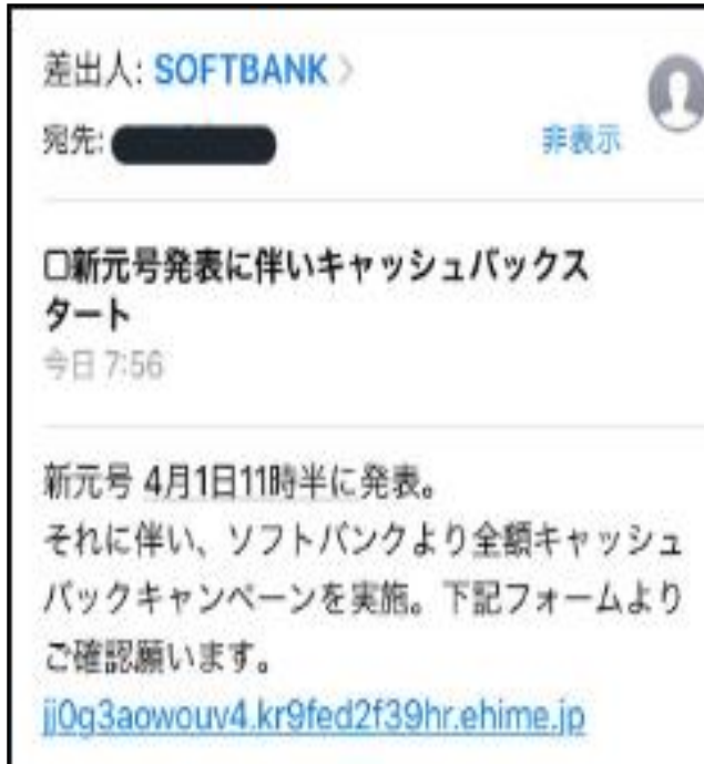
ソフトバンクの例